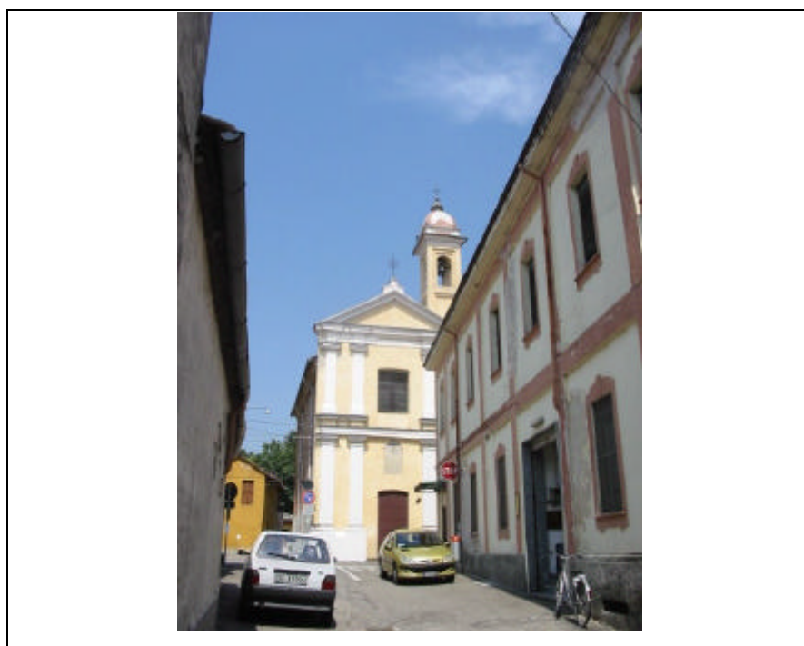
Foto n.12 Chiesa di San Carlo, situata nell'omonima via