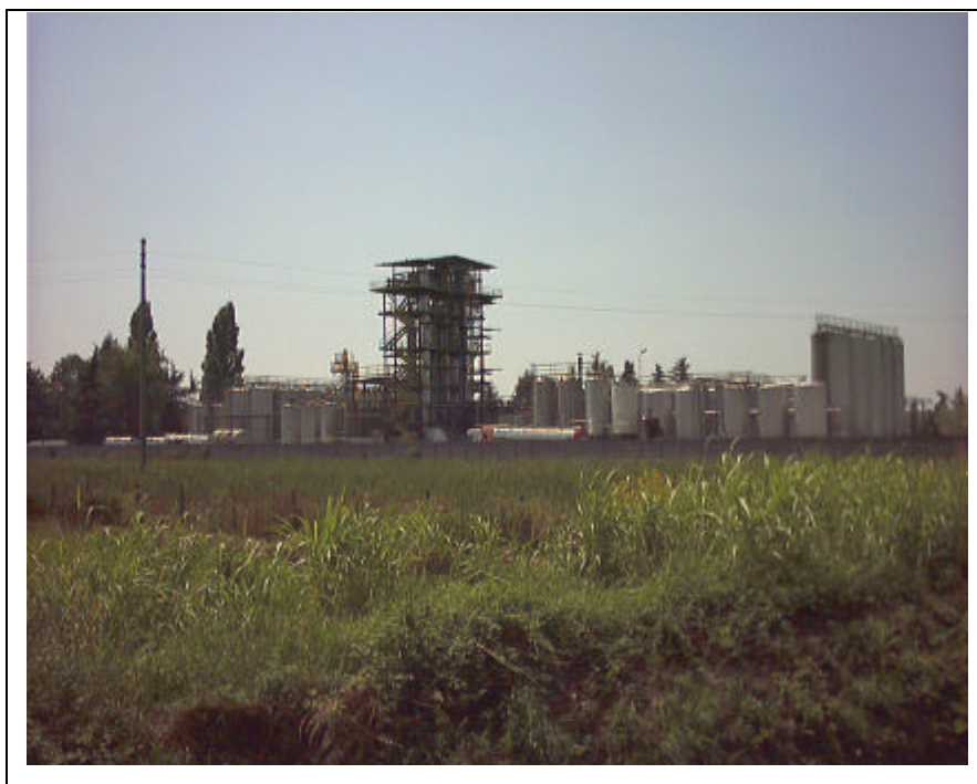
Foto n.17 Impianti industriali della ditta “La Vilchimina s.p.a”, situata in via Oberdam