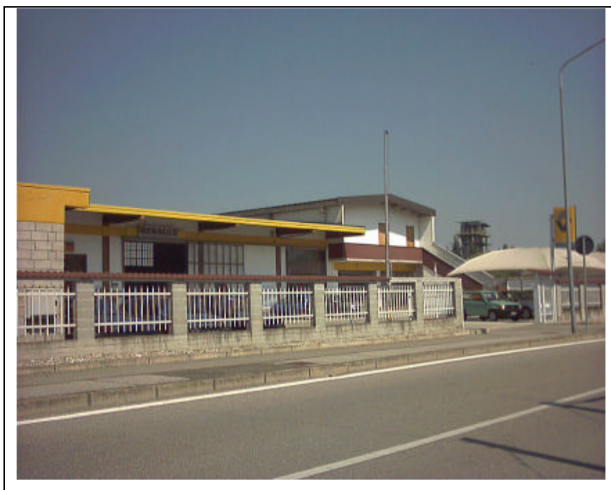
Foto n.22 Officina Renault in via Oberdam