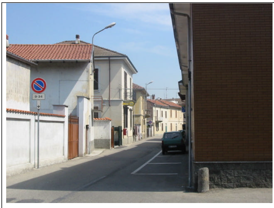
Foto n.7 Sede dell'ufficio postale in via Girella