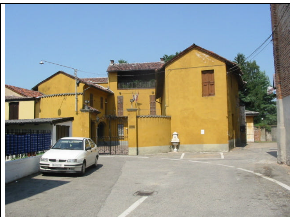
Foto n.10 Sede della Scuola Materna Statale in via S. Carlo