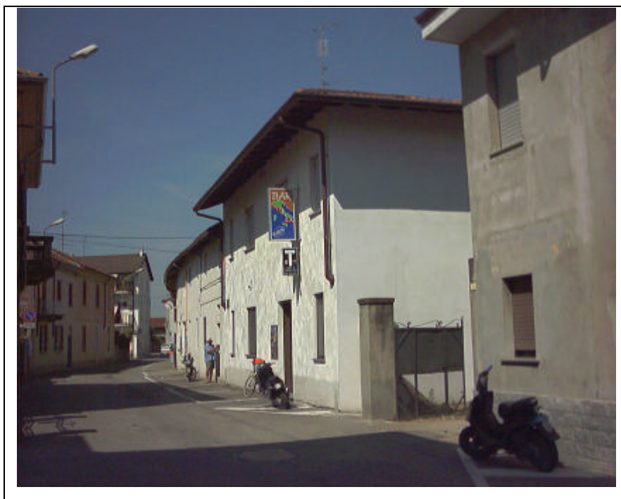
Foto n.25 Bar tabaccheria Italia, in via Girella