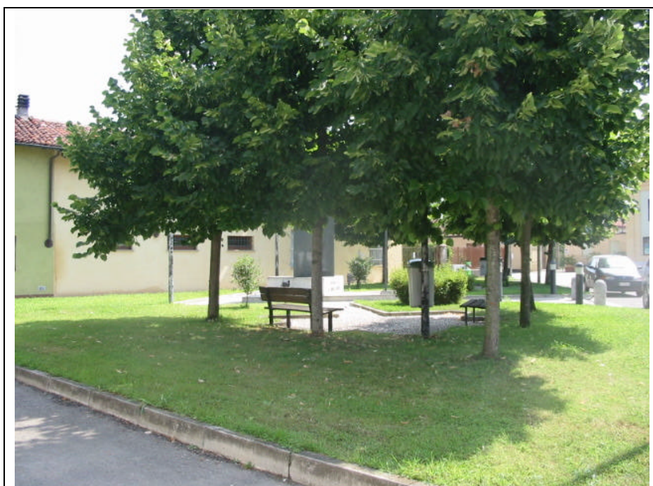
Foto n.6 Giardini pubblici in via Cavour