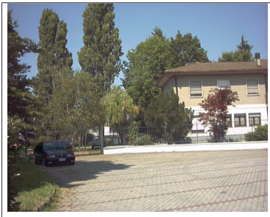
Foto n.23 Accesso da via Oberdam delle industrie “La Vilchimica s.p.a” e dell’edificio residenziale ad esse annesso