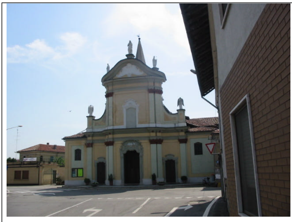
Foto n.5 Parrocchia di Tornaco in via Cavour