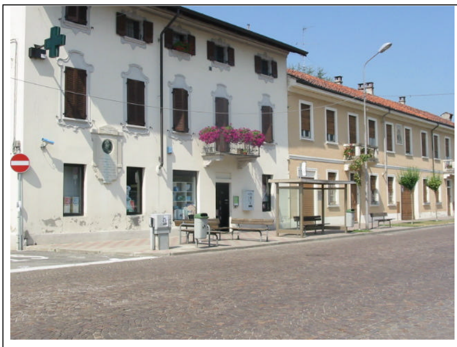
Foto n.2 Farmacia Luoni, in via IV Novembre