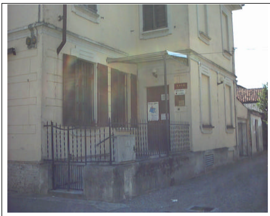
Foto n.26 Biblioteca comunale e sede dell'Avis in via Girella