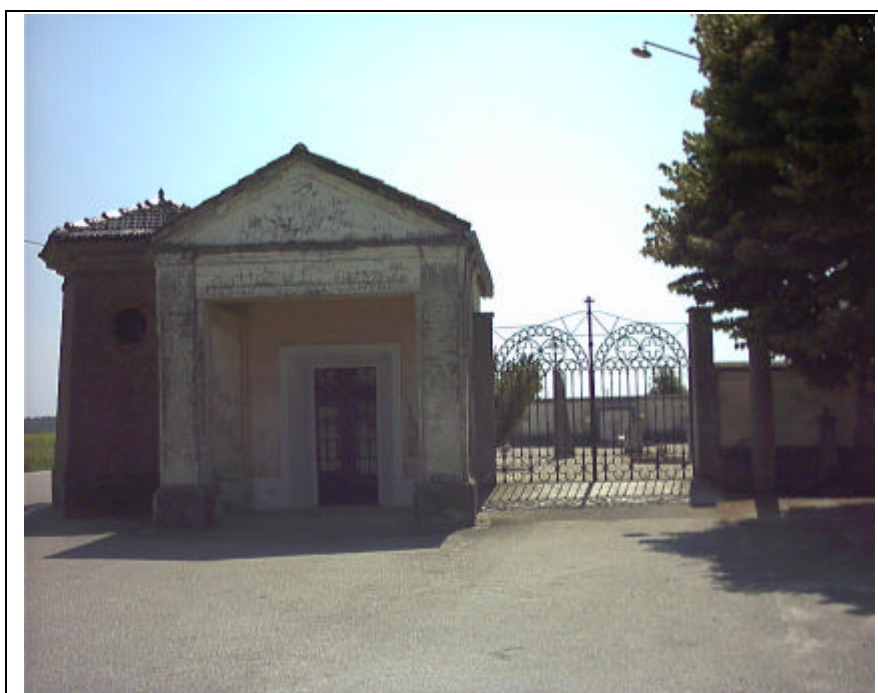
Foto n.18 Area cimiteriale in frazione Vignarello