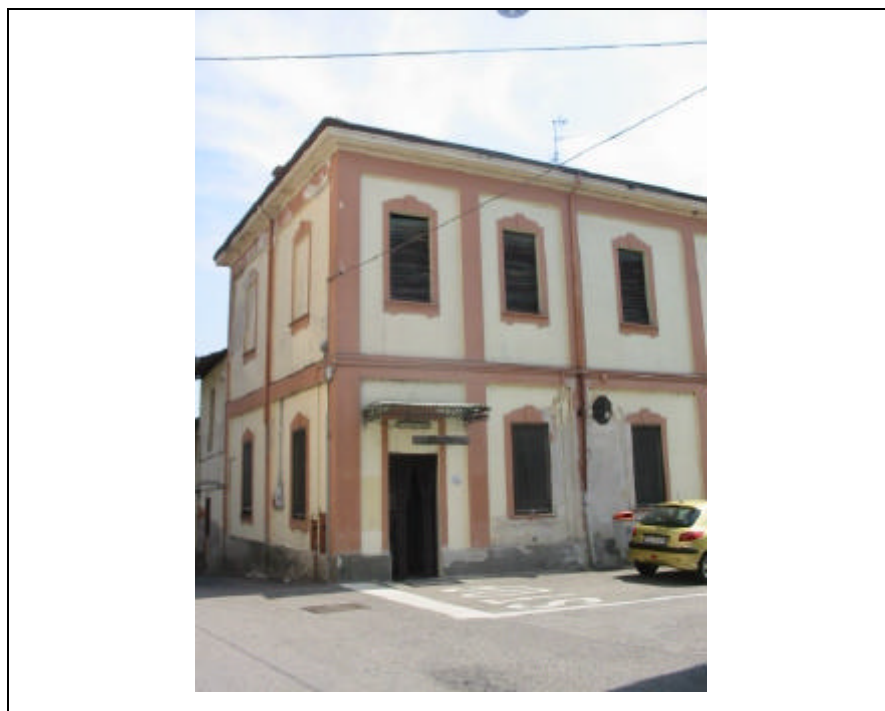
Foto n.11 Circolo Arci in via Mazzini