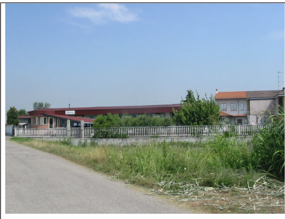
Foto n.9 Sede della “Solmoda s.r.l. suole e accessori per calzature” in via Battisti