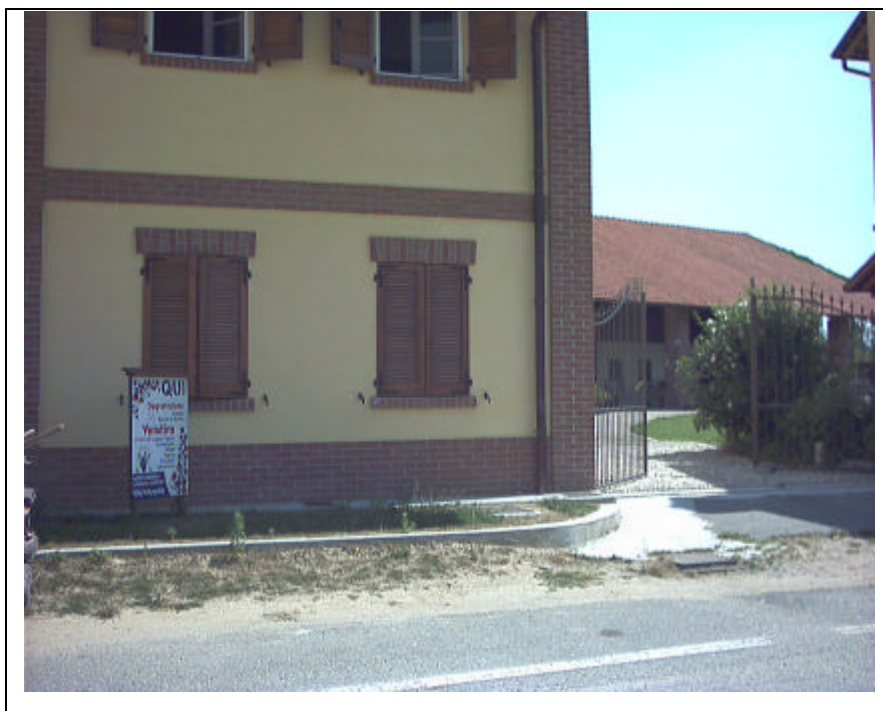
Foto n.19 Agriturismo in località Vignarello