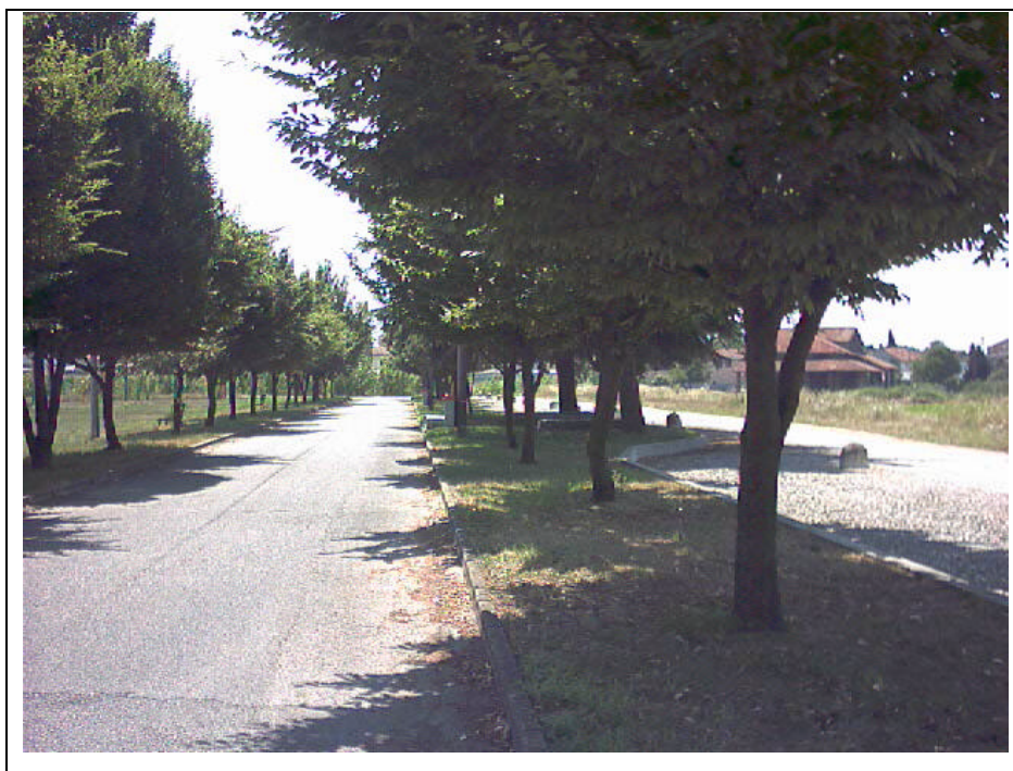
Foto n.15 Verde pubblico e viale ciclo pedonale che conduce al cimitero