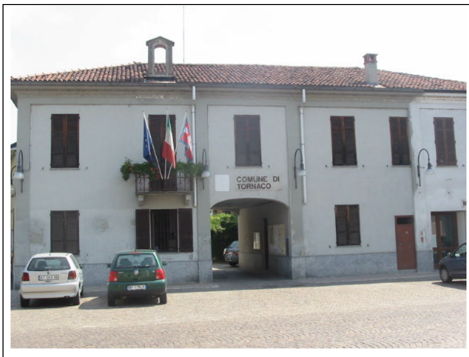
Foto n.1 Sede del Municipio, della Polizia Municipale e degli Uffici Contabilità del Comune, in via Marconi n°4