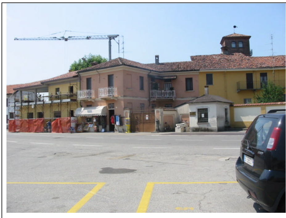
Foto n.13 Tabaccheria, edicola e merceria, situata accanto al peso pubblico in via IV Novembre