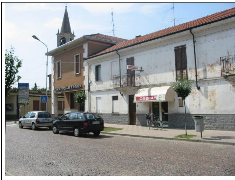
Foto n.3 Negozio di alimentari e sede della Banca Popolare di Novara, in via IV Novembre