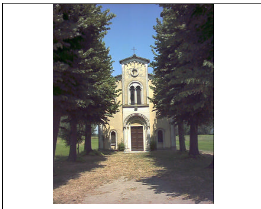
Foto n.16 Chiesa di Santo Stefano lungo la strada che conduce alla frazione di Vignarello